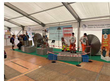
(Berufsbild Swiss Skills)

Die 4 Austragung der Swiss Skills in Bern war ein voller Erfolg. Und einmal mehr hat der Vorstand entschieden das wir an der Swiss Skills 2025 wider teilnehmen. Das ewige Thema, was uns alle beschäftigt ist wie gewinnen wir junge Menschen für einen Handwerklichen Beruf zu erlernen. Die Swiss Skills ist eine grossartige Geschichte.