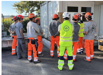
(Classe d'apprentis 2025)

La classe d'apprentis 2025 a commencé avec succès son apprentissage en août. Ces 10 jeunes ont choisi une formation professionnelle exigeante dans un métier manuel.