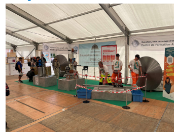
(Profil professionnel Swiss Skills)

La 4 e édition des Swiss Skills à Berne a été un franc succès. Et une fois de plus, le comité directeur a décidé que nous participerions à nouveau aux Swiss Skills 2025. Le sujet éternel qui nous préoccupe tous est : comment attirer les jeunes vers un métier manuel. Les Swiss Skills sont une initiative formidable.